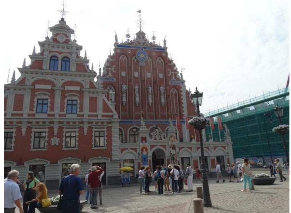
Riga, Hotel de ville