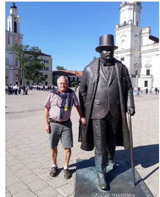
Un grand de Kaunas. Personne de l'AABV n'est à la hauteur