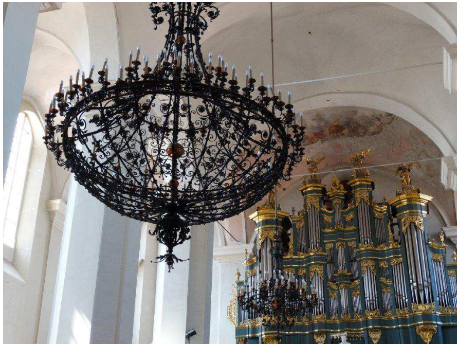
Dans l'église de l'université, nouveau lustre attirant l'attention