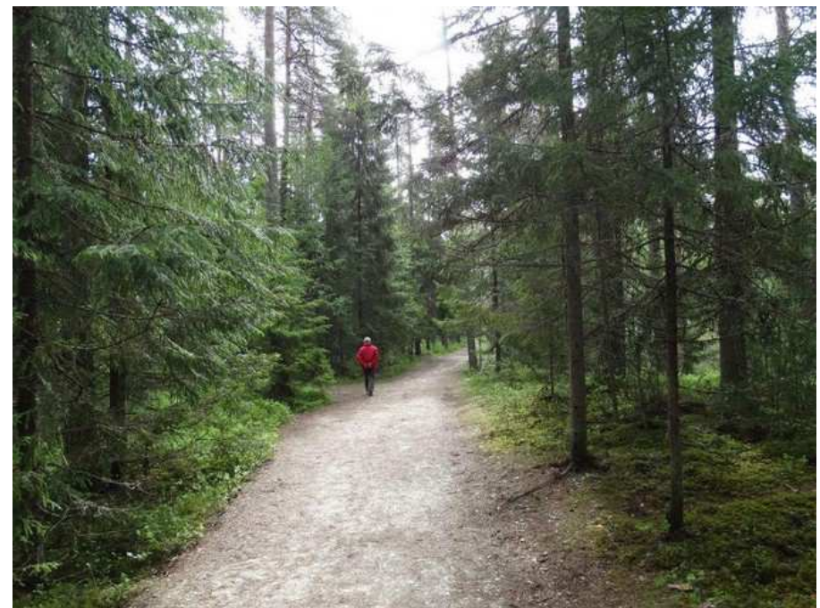
La solitude dans les marais près de Tallinn