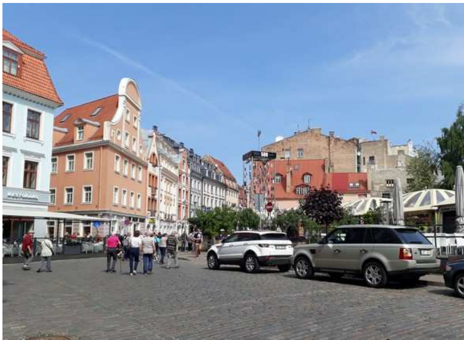
Dans les rues de Riga