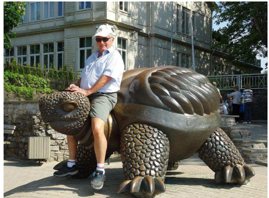
Station balnéaire de Jurmala, bon moyen de visiter sans se fatiguer