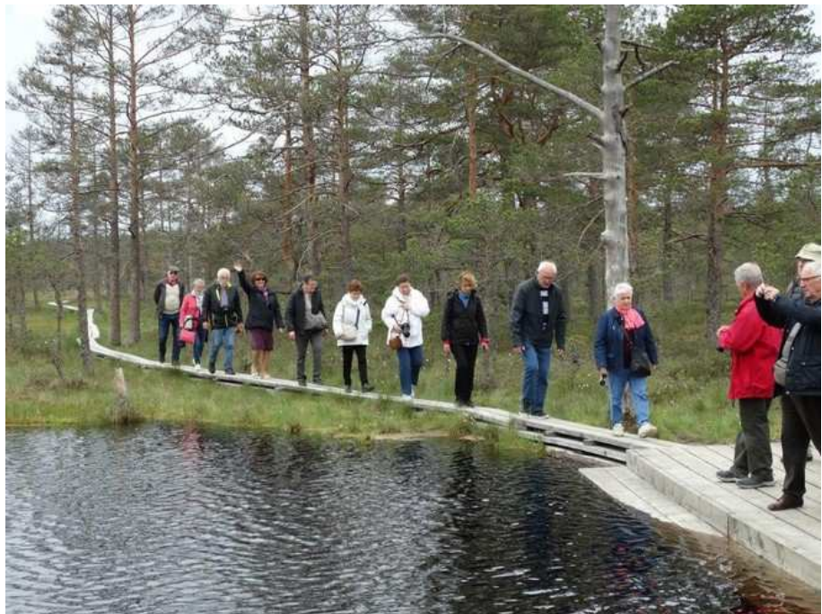
On n'est pas encore perdu mais c'est long