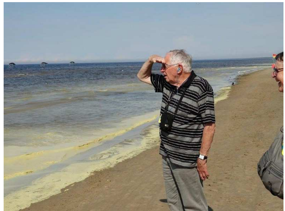
Que vois-je ?