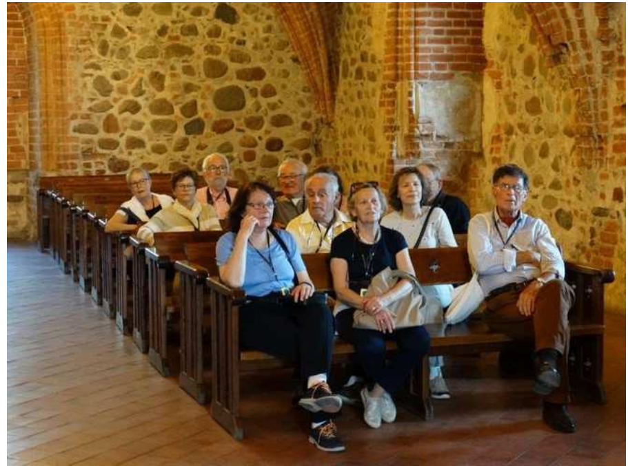
Pose à l'écoute du guide