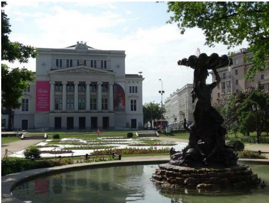
Opéra de Riga