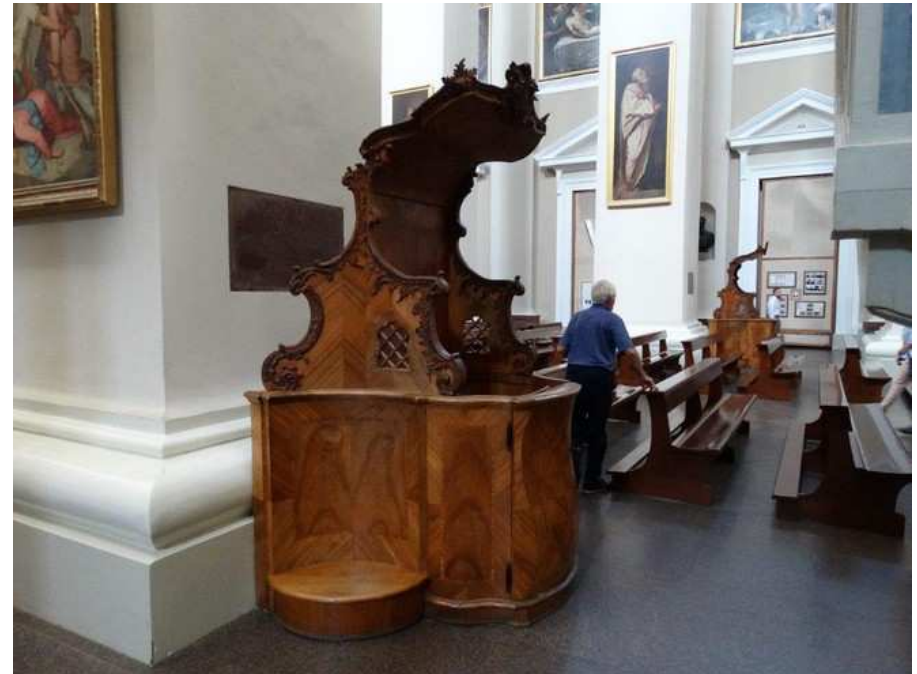
Un confessionnal. Pour la discrétion on fait mieux !