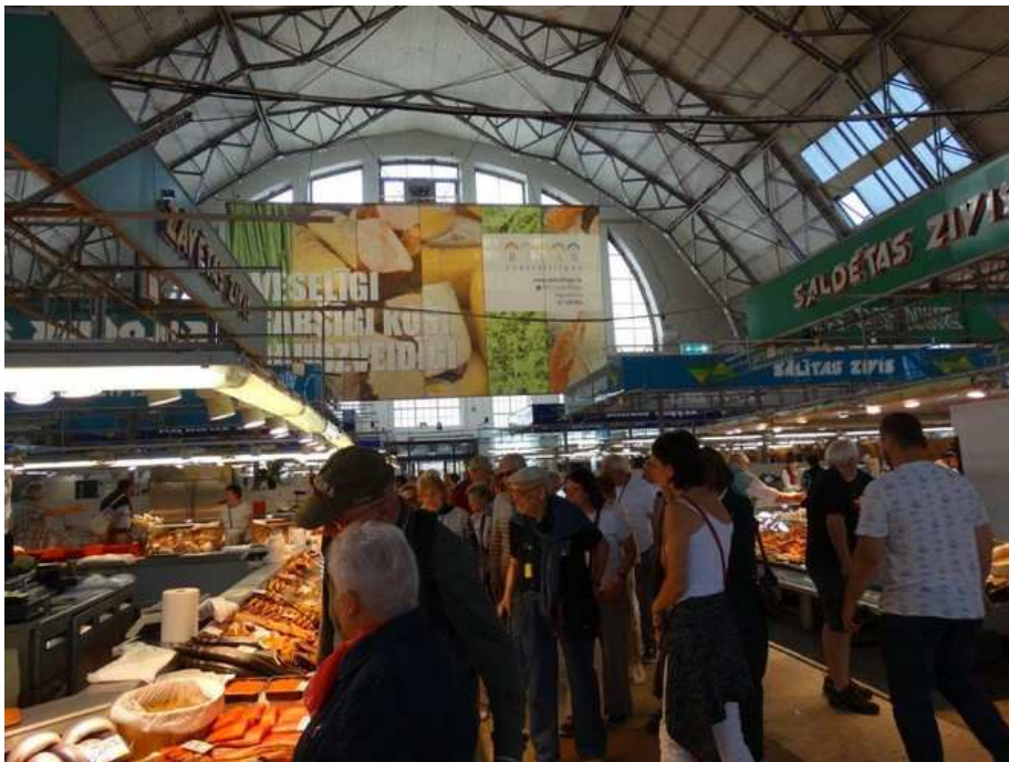
Dans le grand marché de Riga