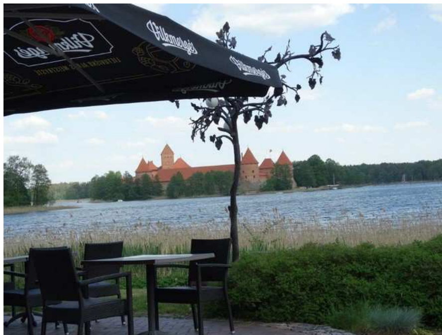
Vue sur le château de Trakai, prêt pour l'assaut