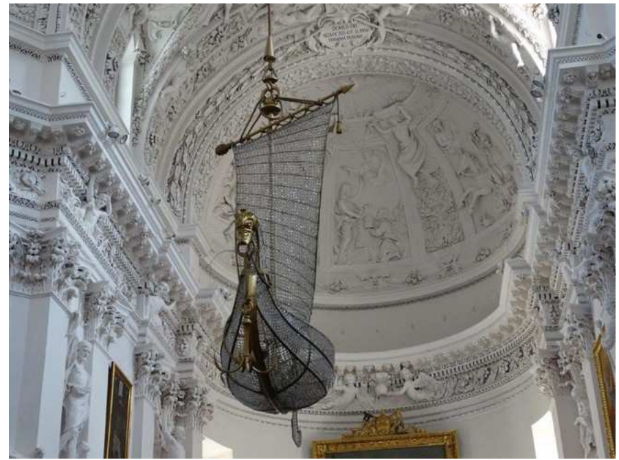
Dans l'église, un lustre bien particulier