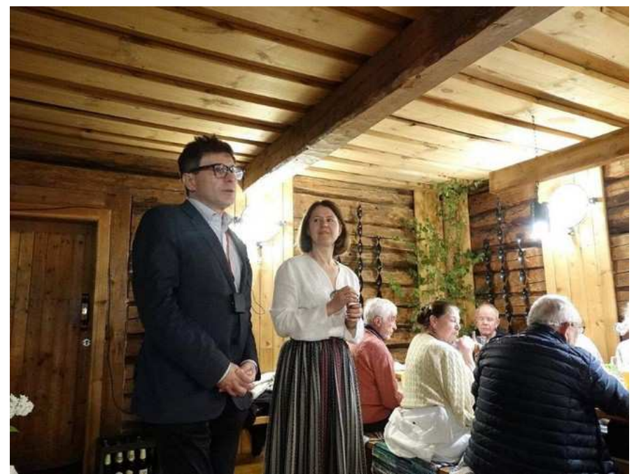
Déjeuner dans une ferme lettone (la propriétaire et le guide local)