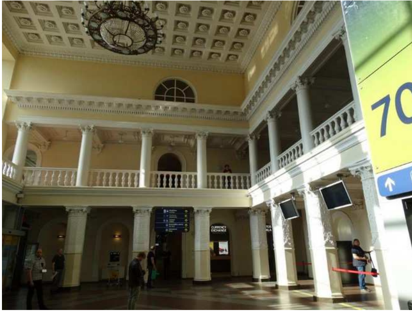
Pour nous mettre dans l'ambiance, terminal de Vilnius