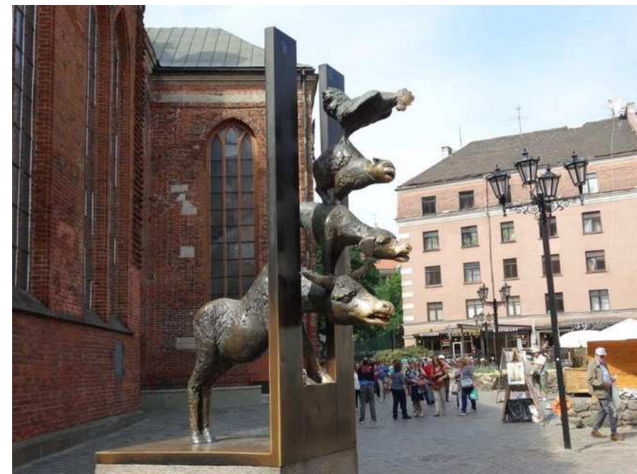
Dans les rues de Riga