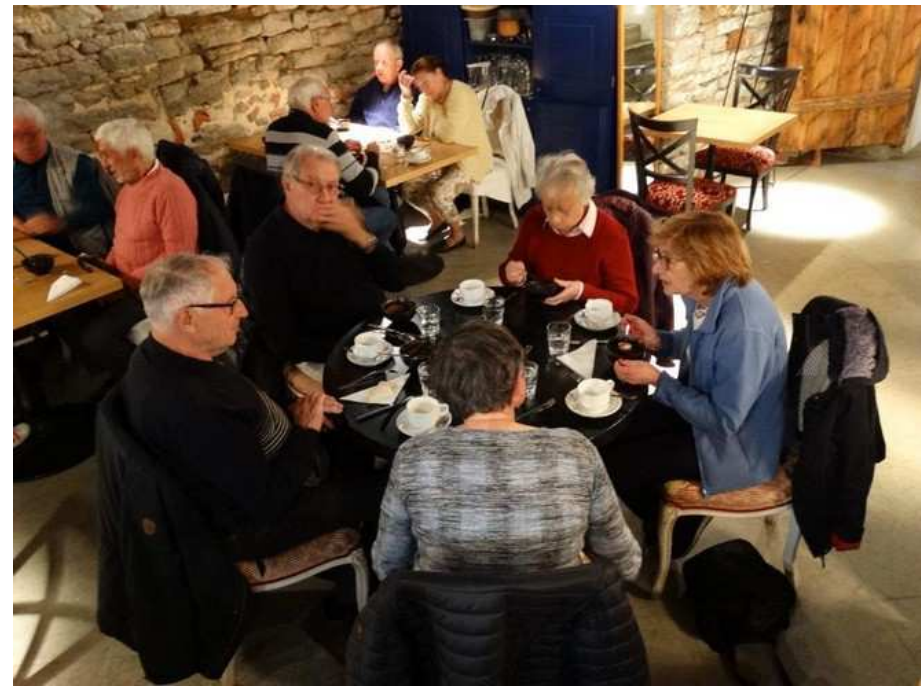
Déjeuner dans une cave