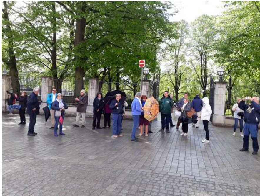
En attendant le car, un peu humides