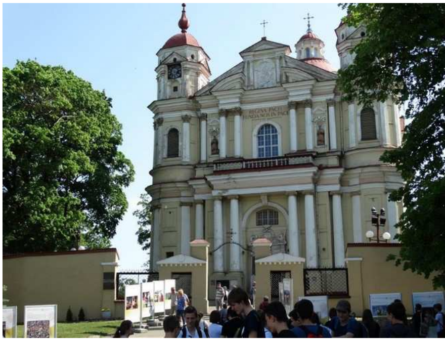
Eglise de Pierre et Paul