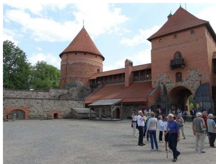
Château de Trakai vu de la cour