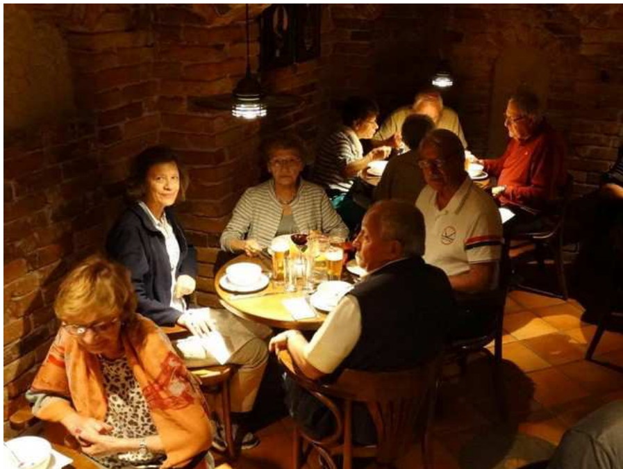
Kaunas, déjeuner à l'ombre en route pour Riga