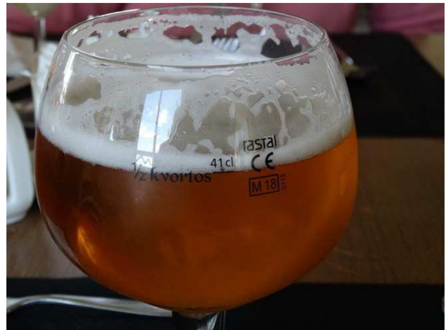
A votre santé, aucun risque, certifié CE