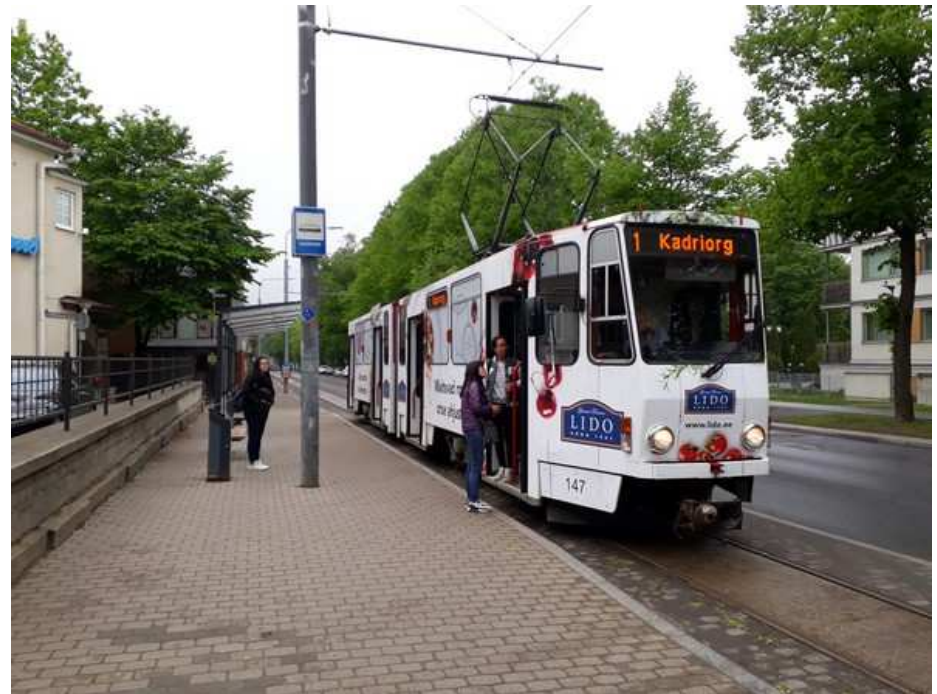
Dernier coup d'œil avant le retour