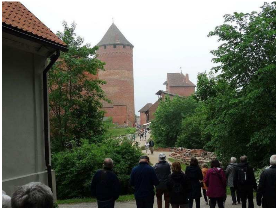
En route pour Tallinn, le château de Sigulda