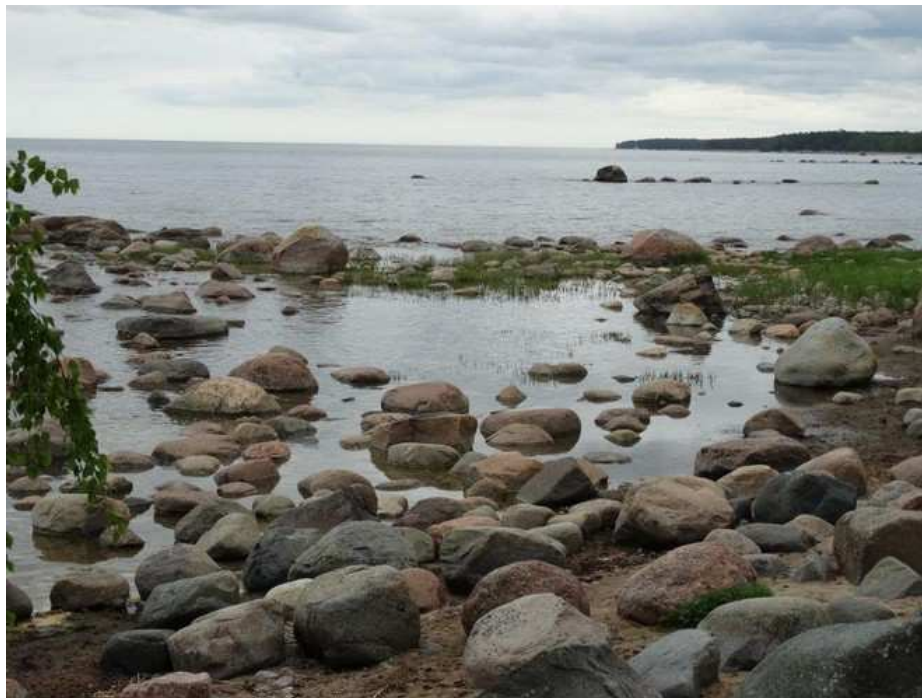
Paysage estonien: pierres roulées laissées par les glaciers