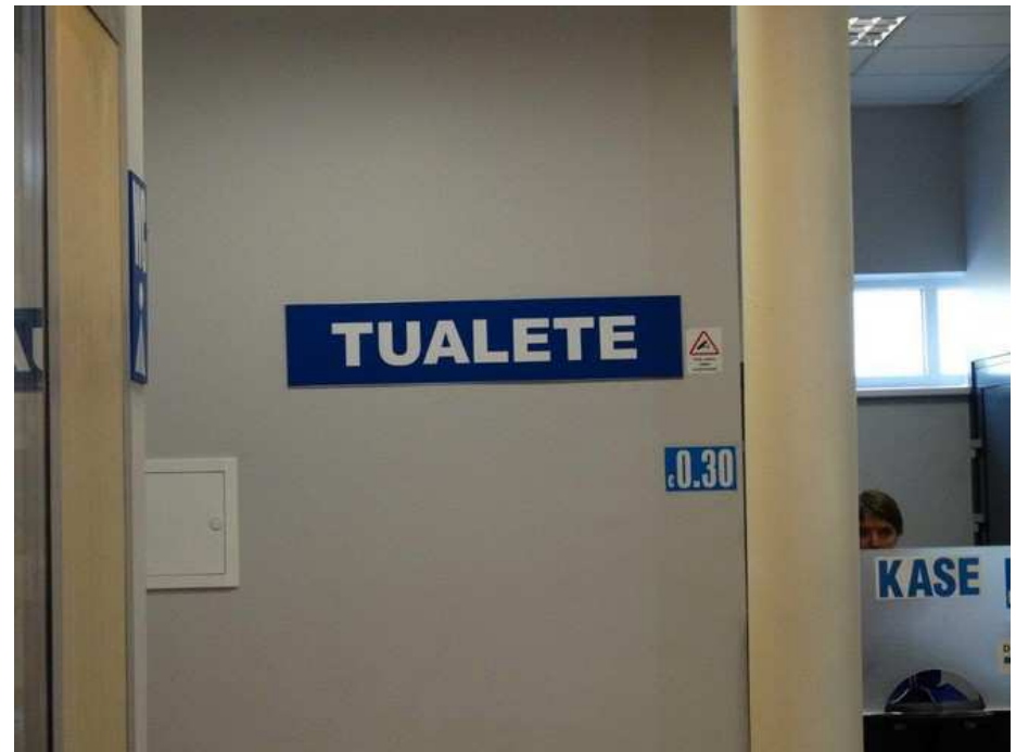
Pas besoin de traducteur