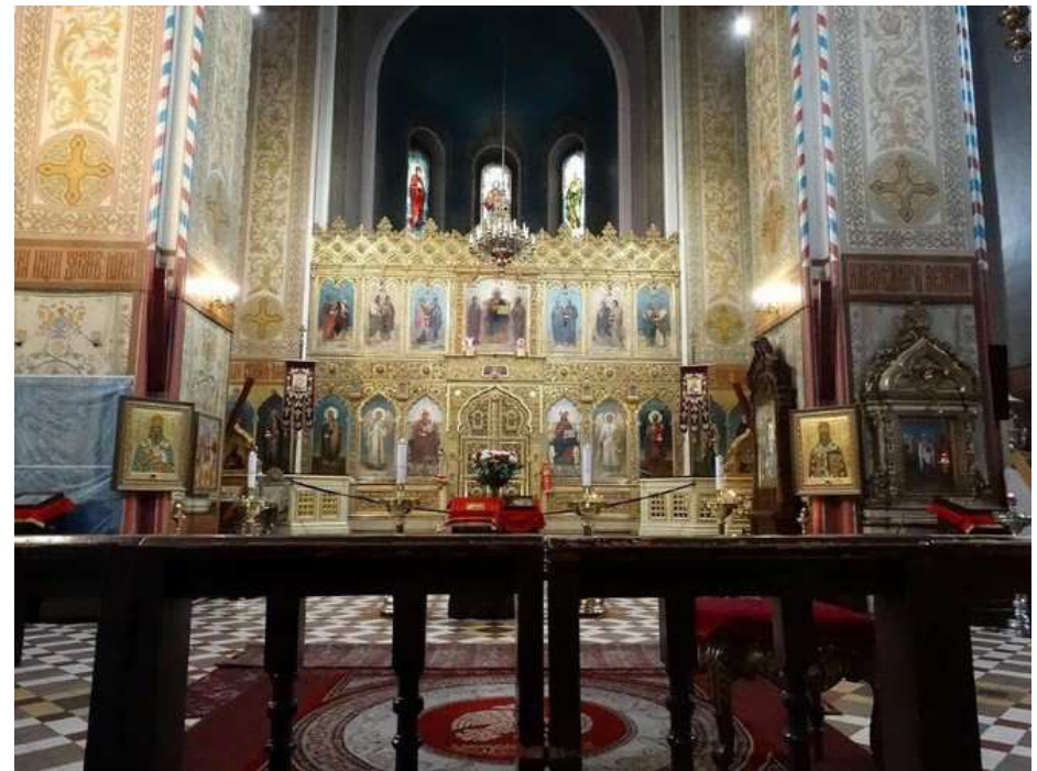
La cathédrale orthodoxe Nevsky de Tallinn