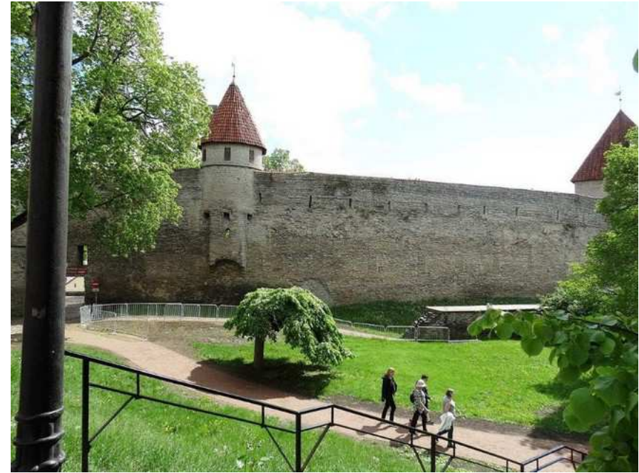
Tallinn et ses remparts