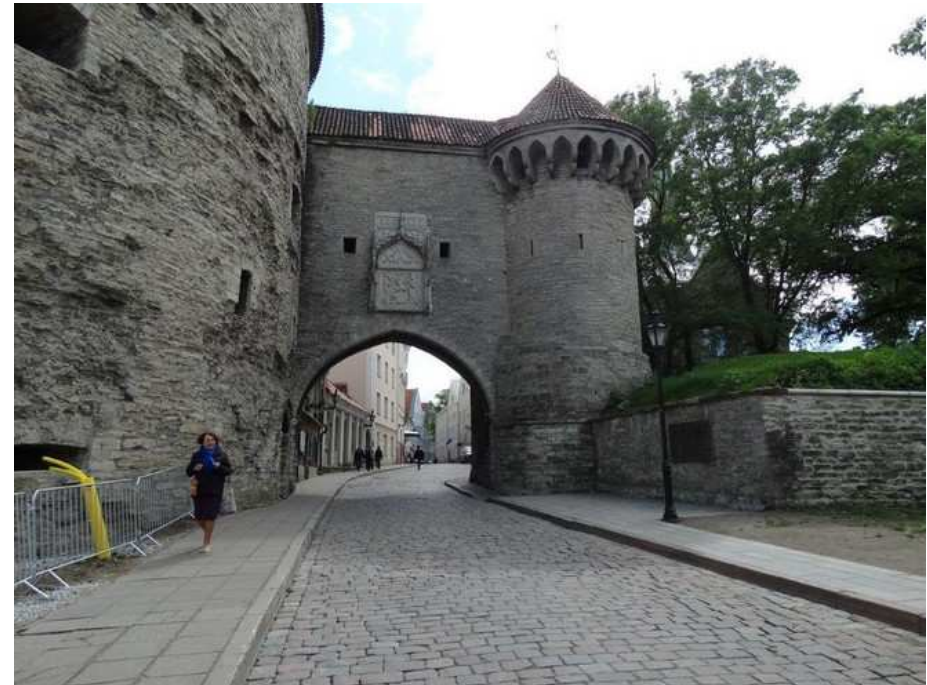
Temps libre à Tallinn