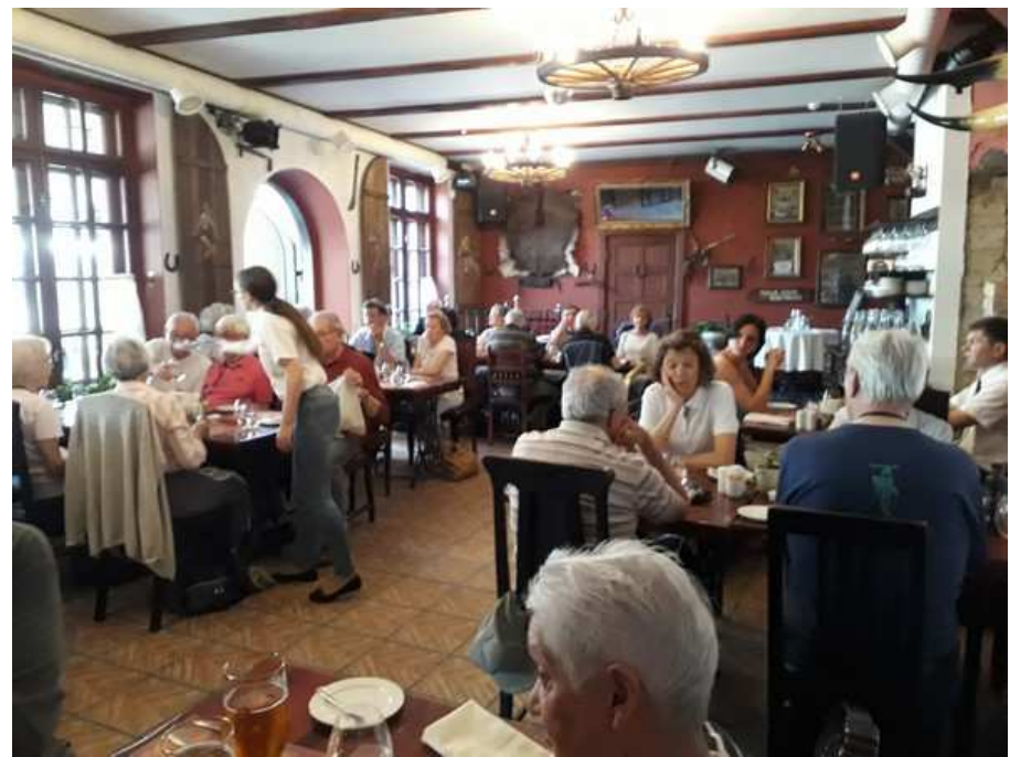
Pour reprendre des forces, déjeuner à Riga