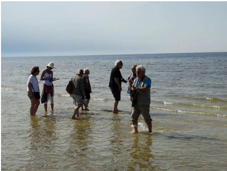
Les pieds dans l'eau, un bon moyen de se relaxer des visites