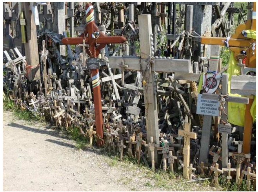
Sur la route de Riga, la colline des croix à Siauliai