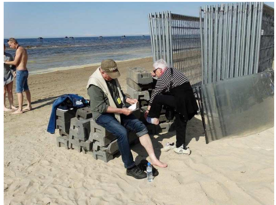
Pays Baltes = mer Baltique, enfin la voilà