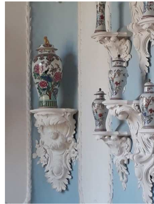
Porcelaines dans le Palais