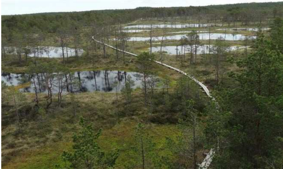
Le sentier des castors (marais)