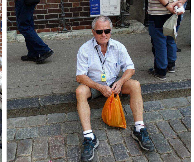
Les rues de Riga! très intéressant, mais fatiguant tout de même