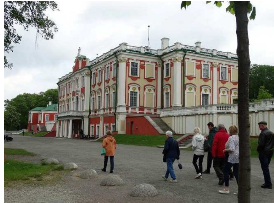
Tallinn, Palais de Kadriorg