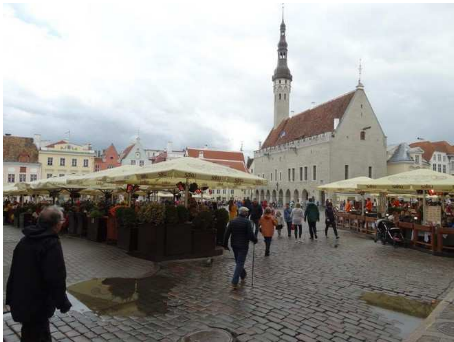
Grand place de Tallinn