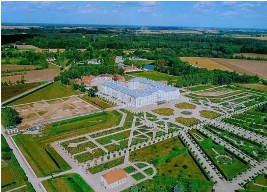
Palais de Rundale, vue du ciel (photo d'une photo)