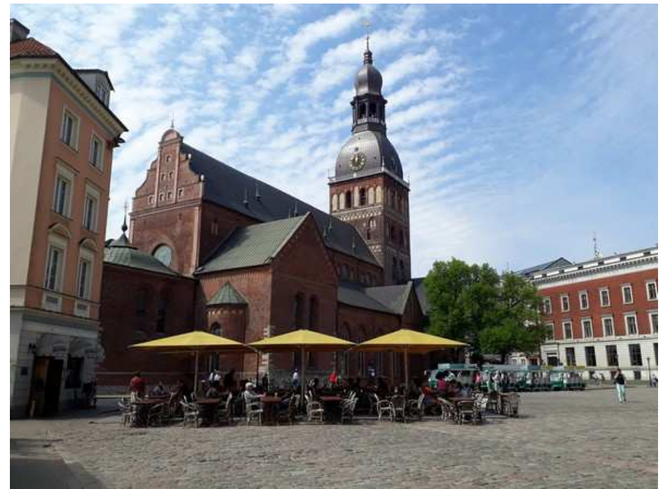
Place de l'église