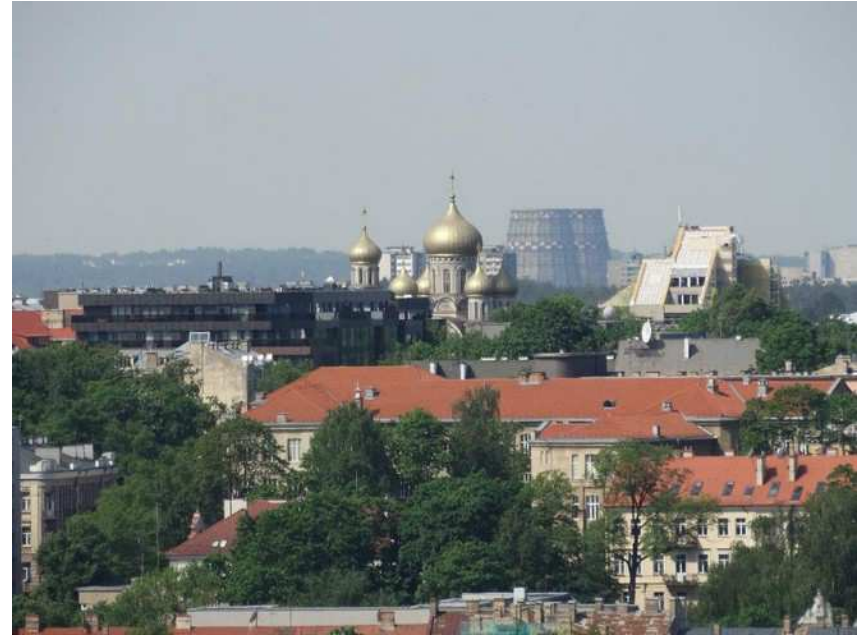
Vilnius vu d'en haut